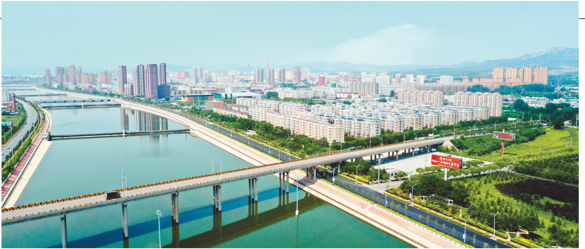
如今的建平路通、街畅、景美。

其时已至,其势已成。建平人以永不停歇的坚定步伐,踏上共建文明之城、共享文明之美的旅程,奋力打造幸福文明、和谐宜居新建平。