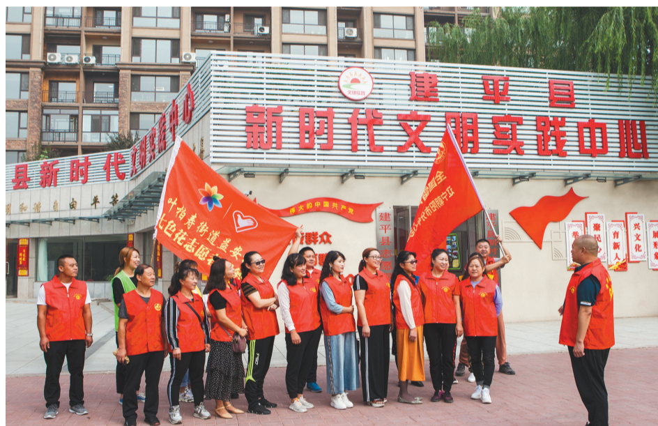
“七色花”志愿者团队走进社区开展文明实践活动。

改,对久而不决、扯腿创城的单位发专报追责,以督促到位、指导到位、考评到位,推动创城工作一以贯之抓下去,坚持不懈推上去。全县上下树牢“一盘棋”思想,拧成一股劲,加大联动力度,形成责任部门倾力而为、相关部门密切配合、企业单位积极融入、社会力量广泛参与的全民共建共治共享的创城格局。