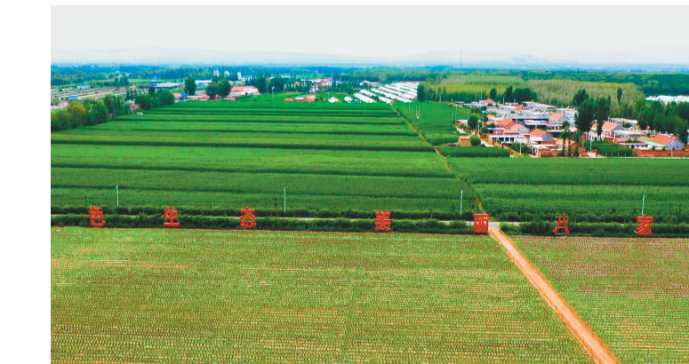
美丽乡村八家农场。