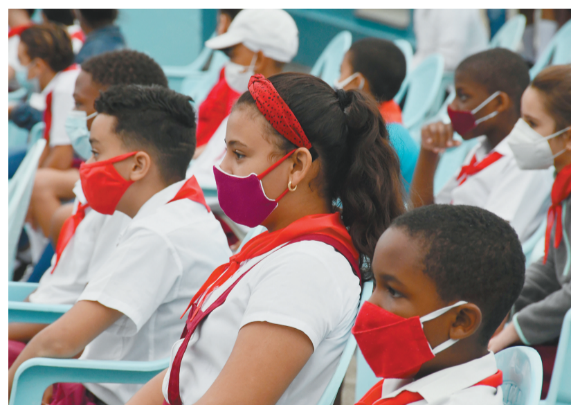
11月15日,古巴哈瓦那一所小学的学生参加校园活动。鉴于国内新冠疫情持续缓解,古巴近期出台多项新规,放松防疫限制措施。15日起,已接种新冠疫苗的国际旅客可凭接种证明入境古巴,无需再提供核酸检测阴性证明。