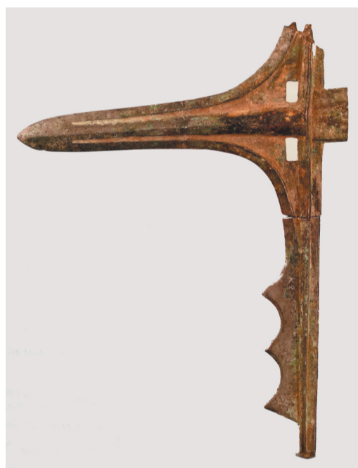
青铜异形戈(喀左出土)。

记者了解到,我国古代的青铜器以商周时期的中原地区最为发达。辽西地区青铜冶铸业初起之所以能够较快发展,是因为迅速吸收了中原地区的先进生产经验,在发展道路上走了捷径。青铜器不断从辽西扩大到整个东北地区。由于青铜器的冶炼水平不如中原发达,辽西地区多是制造兵器和一些小件饰品,很少铸造大