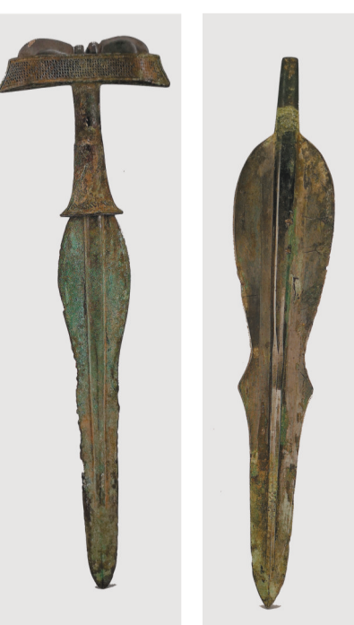
曲刃青铜短剑及剑身结构示意图。