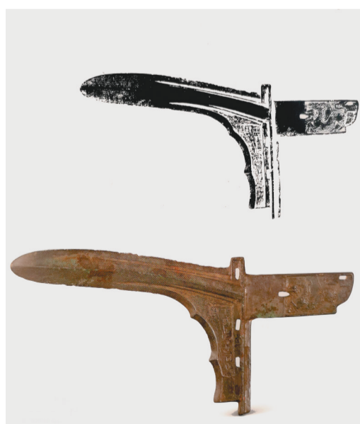
燕王职青铜戈(北票出土)铭文拓印为“燕王职作御司马”。