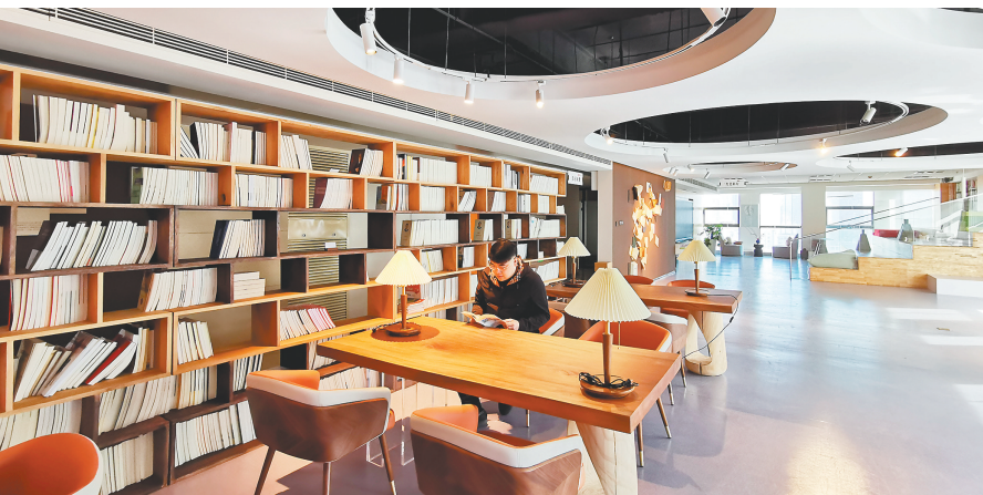
沈阳市和平区三好街附近的城市书房“96号书房”内的阅读者。