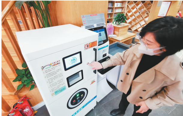
大连市西岗区城市书房八一路店购置图书消毒机方便读者。