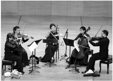
“飞·粤”弦乐四重奏音乐会现场。

为不断提升城市审美品位,以艺术涵养城市精神,2021沈阳艺术节注重遴选专业、精品艺术活动,众多知名艺术家携优秀作品会聚沈阳,让观众领略到高雅艺术的魅力,提升群众文化素养。舞台艺术方面,一批精品剧目火爆剧场,如融合国内外金奖杂技节目的开幕演出——杂技剧《忆·华年》,“第九届中国京剧艺术节”和“辽宁省庆祝中国共产党成立100周年优秀舞台艺术作品展演”入选作品——现代京剧《关东女》,“金秋十月”交响音乐会,京剧名家于魁智、李胜素领衔主演的传统京剧《龙凤呈祥》,百老汇经典音乐剧《拜访森林》中文版,小剧场剧目《一夜一生》及第四届1905国际