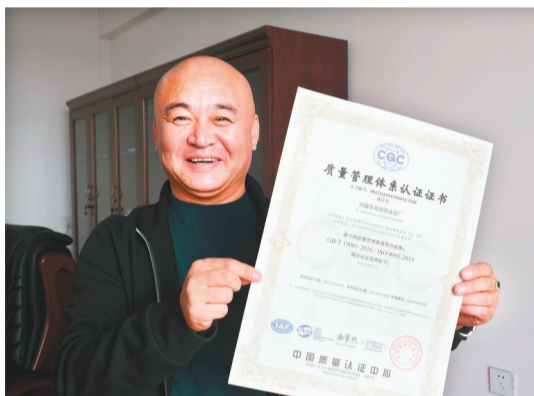
兴城市美诗奇泳装厂获得了ISO9001质量管理体系认证。