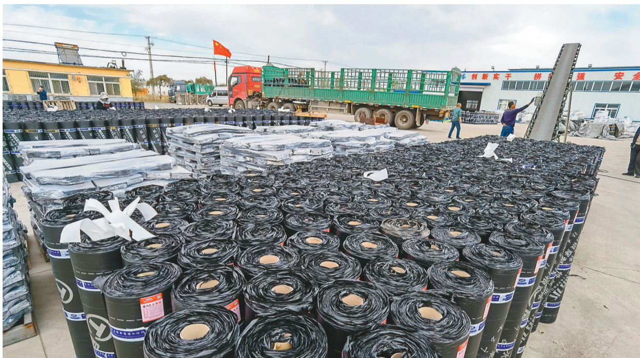
辽宁辰泰防水科技发展有限公司产品热销。

是因为标准太远、现实太近,还是“高大上”的标准让小微企业难以消化?请看本报调查——