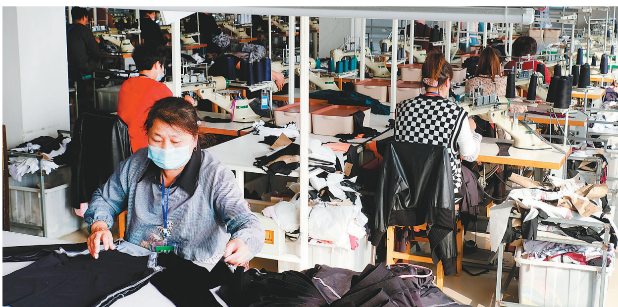
兴城市华邦体育用品有限公司生产车间。