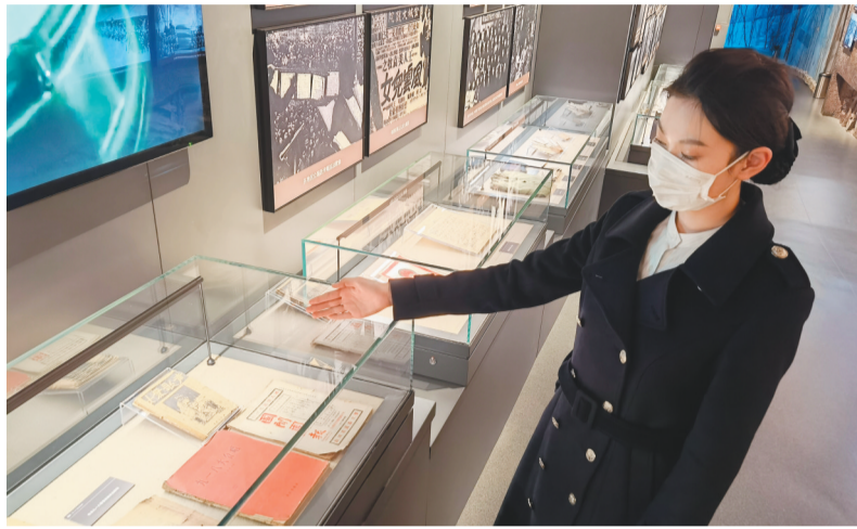
沈阳“九·一八”历史博物馆展陈中的抗战文化史料。

年之际。张洁说,就当时抗战形势而言,全民族抗战爆发后,全国人民日益凝心聚力,民族意识空前增强。中国共产党为中国抗战指明了方向,坚定了全国人民的必胜信心。此时,身处延安的冼星海创作《九一八大合唱》,就是在时代的感召下,以艺术方式宣告中国人民正在经由“沉痛的历史”转向“光明的未来”,这是中国共产党人为团结抗战力量、鼓舞抗战斗志、争取抗战胜利而创作的重要文艺作品。