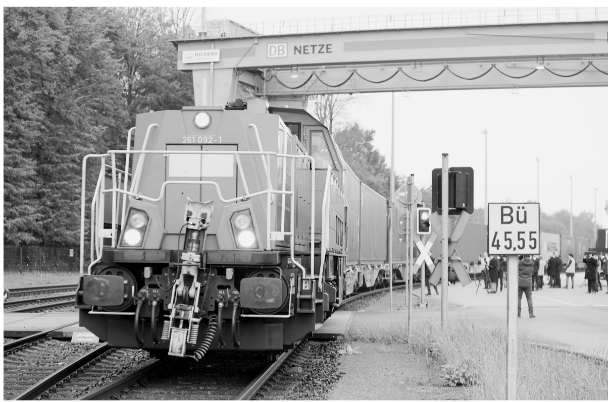
10月26日,首列“上海号”中欧班列驶入德国汉堡的货场。德国汉堡26日举行仪式,欢迎首列“上海号”中欧班列顺利抵达。9月28日,首发“上海号”列车装着50个满载服装鞋帽、玻璃器皿、汽车配件、精密仪器等货物的集装箱,从上海一路向西,经新疆阿拉山口口岸出境,开往汉堡。该班列目前每周开行一次,之后将逐步增加开行频次并开拓新线路。