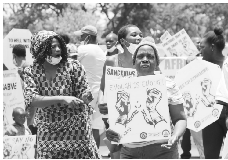
10月25日,人们在津巴布韦首都哈拉雷的美国驻津使馆附近举行游行示威,抗议西方国家非法制裁。当日,津巴布韦总统姆南加古瓦表示,英美等西方国家的非法制裁给津巴布韦造成严重影响,西方国家应尽快解除对津制裁。