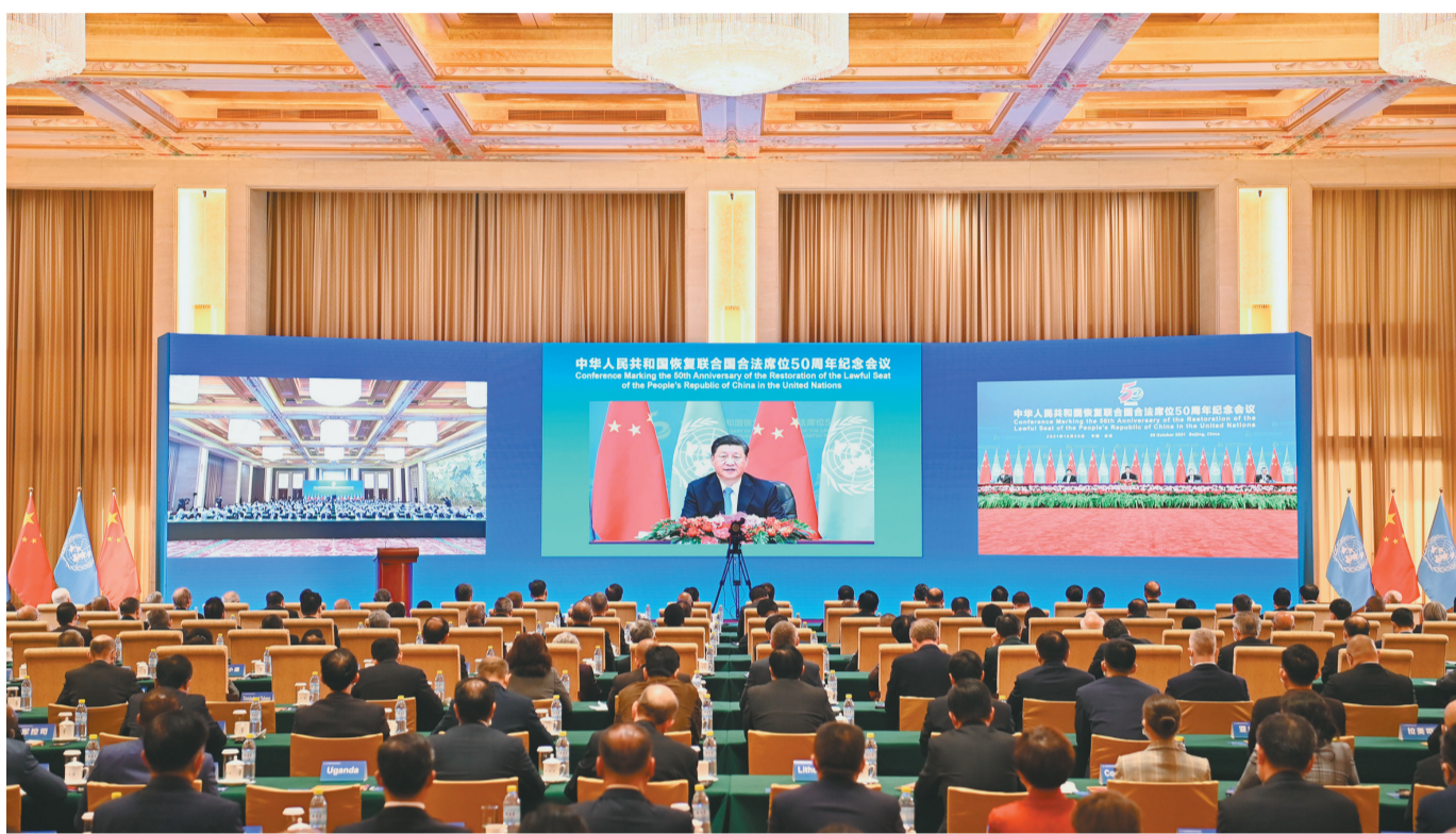
10月25日,国家主席习近平在北京出席中华人民共和国恢复联合国合法席位50周年纪念会议并发表重要讲话。

新华社北京10月25日电 国家主席习近平25日在北京出席中华人民共和国恢复联合国合法席位50周年纪念会议并发表重要讲话。习近平强调,新中国恢复在联合国合法席位以来的50年,是中国和平发展、造福人类的50年。中国将坚持走和平发展之路,始终做世界和平的建设者;坚持走改革开放之路,始终做全球发展的贡献者;坚持走多边主义之路,始终做国际秩序的维护者。中国愿同各国秉持共商共建共享理念,弘扬全人类共同价值,践行真