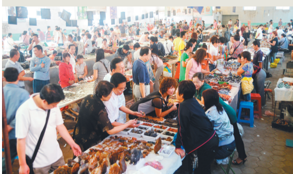
2001年,阜新蒙古族自治县十家子镇玛瑙大集上,人流如织。