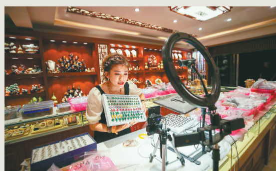
2021年,十家子镇玛瑙业户转战线上,网络直播带货成为零售新主流。