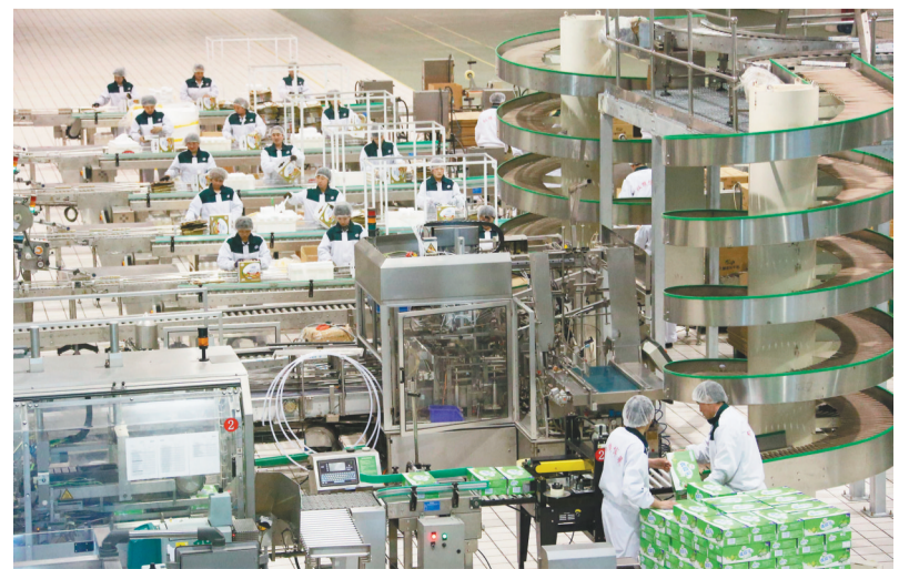
阜新绿色食品产业蓬勃发展,直接带动农业增效、农民增收。

自本世纪初实施转型以来,遇到的困难超乎想象,付出的努力非同寻常,取得的成绩来之不易。从起步阶段的摸着石头过河到推进阶段的多点并进,再到升级阶段的全面提质,20年负重前行、20年不懈探索、20年一张蓝图绘到底。在这段浴火重生的不平凡岁月洗礼下,这座转型城市也从蹒跚起步的稚子成长为步履矫健的青年,激情满怀、砥砺前行,奋力开创辉煌灿烂、前程似锦的新时代。