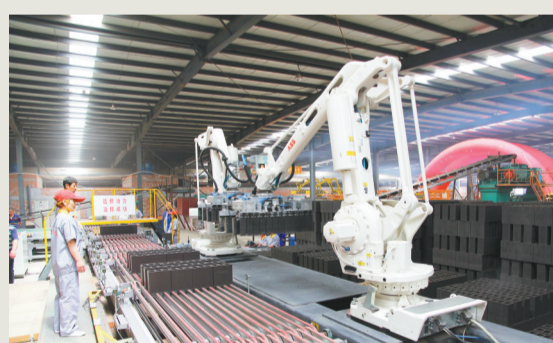
2021年,机器人替代人工,省时省力效率高。