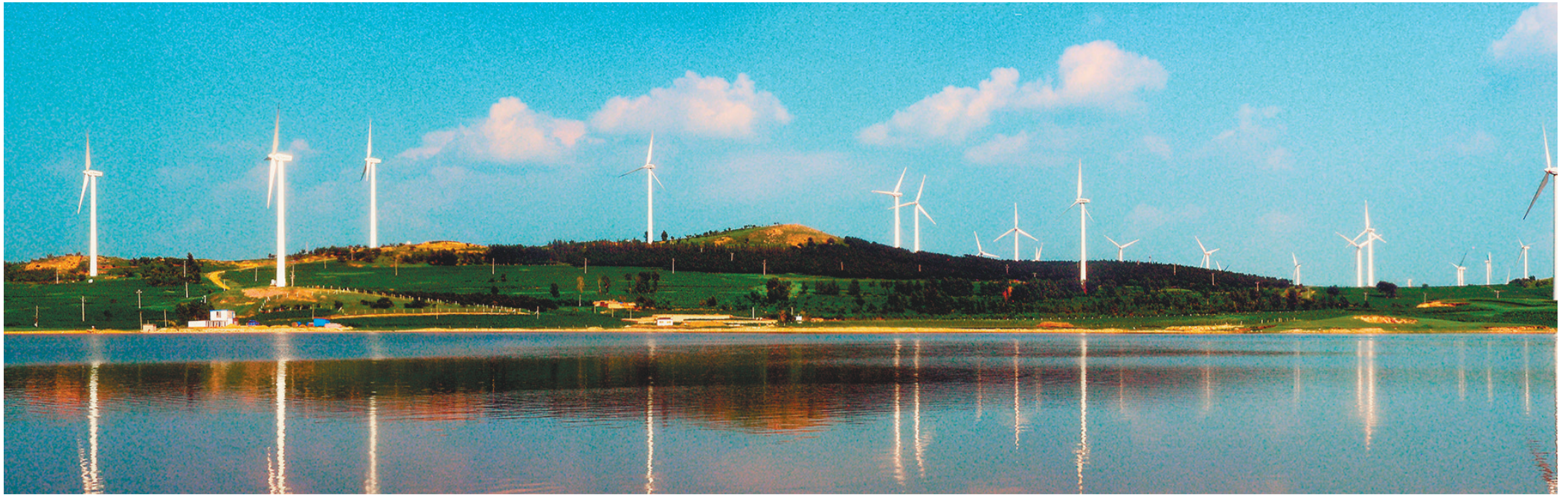
彰武县巨龙湖畔的白色风电机组,在蓝天白云映衬下,美轮美奂。

从即日起,本报将陆续推出“阜新经济转型20周年系列报道”,全方位、多层次、全景式展现阜新的转型历程,以汲取赓续前行的智慧,凝聚高质量转型、全方位振兴的澎湃力量。