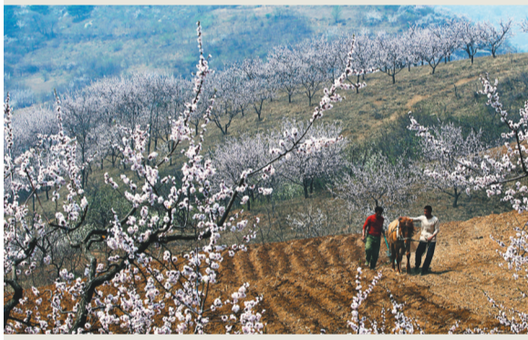
2001年,用牲畜拉犁是春耕的主要方式。