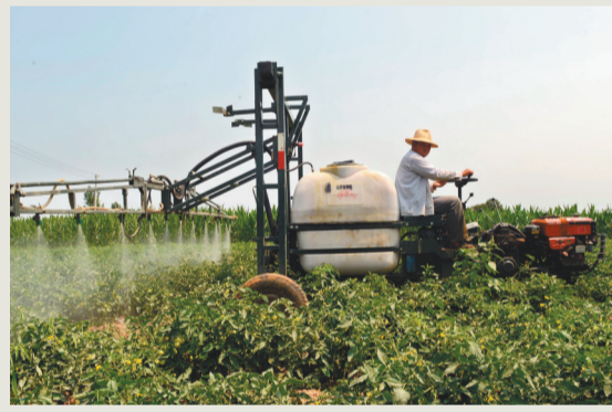
2021年,阜新农业机械化率达到90%。