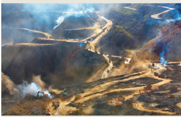
2001年的新邱露天矿采煤现场。2018年,此处开始建设阜新百年国际赛道城。

事非经过不知难。20年间,阜新人咬定青山不放松,下狠心“刮骨疗毒”,从资源依附型的“病态特征”转变为高质量转型、全方位振兴的“健康体魄”。在探索资源型产业迈向新型工业化的道路上,阜新同步破解并着重回答了资源型城市转型的产业走向问题。