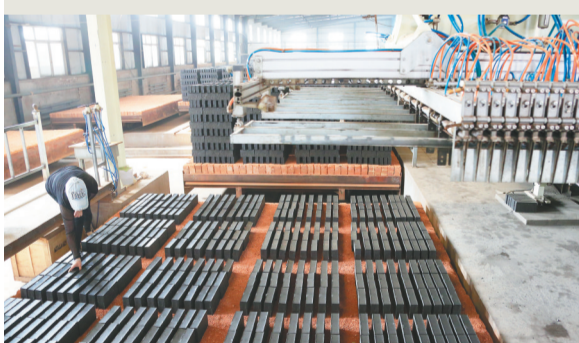
2001年,新邱区煤研石制砖厂还要依靠大量人力。