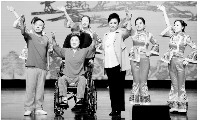
凌源影调戏《婆婆还乡》剧照。

展演中涌现了一批优秀作品,如拉场戏《送兔》、铁岭秧歌剧《山乡春晚》、海城喇叭戏《绿水青山情满天》、评剧《七月枣八月红》、辽剧《创业》、《夜审》、木偶戏《红缨如火》等,反映了脱贫致富、振兴乡村、保护环境、建设美好家乡、歌颂英雄等主题。小戏投入少、创作周期短、方便演出、贴近生活、接地气,有利于培养人才。一些编剧的作品首次登上舞台,有的年轻演员首次担纲主演。小戏作品以小见大、小故事寓重大道理,小舞台揭示大世界,全面集中展示了辽宁地方戏曲的艺术特色和创作水平,得到专家和观