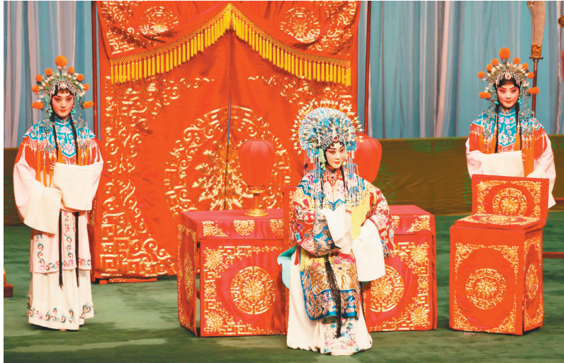
京剧《龙凤呈祥》剧照。

国家京剧院历史悠久、名家名剧荟萃,阵容整齐,艺术严谨,风格鲜明。目前,国家京剧院一团的演员阵容以多年来深受广大喜爱的艺术家为主体。其中,于魁智被誉为“当今京剧