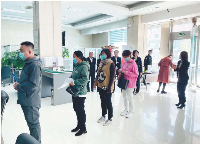
在工行铁岭银州支行,客户踊跃购买辽宁省政府债券。