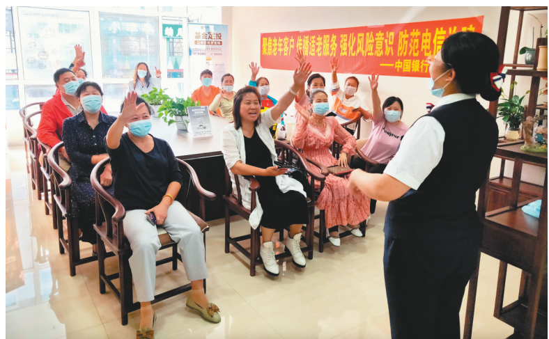
中国银行本溪分行针对老年客户举办反诈宣传讲座。(资料片)

中国银行辽宁省分行积极贯彻落实监管机构和总行工作要求,组织开展了以“金融知识普及月 金融知识进万家 争做理性投资者 争做金融好网民”为主题的金融消费者权益保护宣教活动,针对不同人群金融知识的薄弱环节和金融需求,开展金融知识普及活动。中国银行辽宁省分行不断提升服务能力和水平,以客户需求为导向,帮助金融消费者和投资者理性选择适合自己的金融产品和服务,远离非法金融活动,切实保障自身利益。