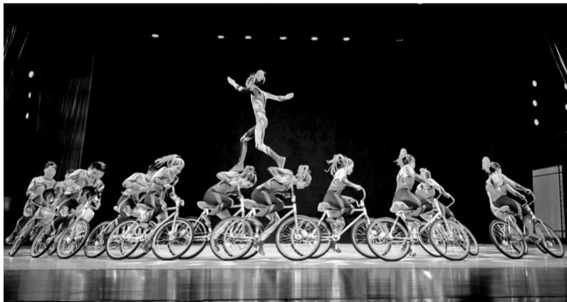
原创杂技剧《忆·华年》精彩上演。

亮丽炫目的舞美、环环相扣的情节、技艺精湛的表演……充分展示了杂技艺术的力与美,给观众带来了全新的视觉震撼,现场不时传来雷鸣般的掌声。