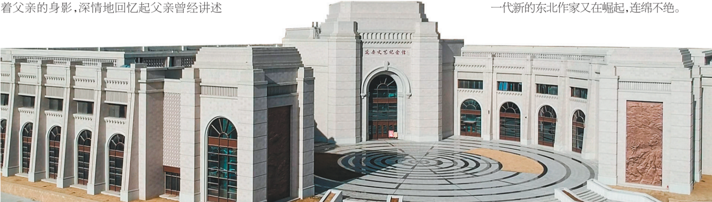
位于鲁迅艺术学院旧址旁新建的延安文艺纪念馆。

东北革命的文学仍在继续前进,东北作家仍在前进,并开拓、迈进一个新的历史和文学领域,这就是历史运动的规律。在他们身后,一代新的东北作家又在崛起,连绵不绝。