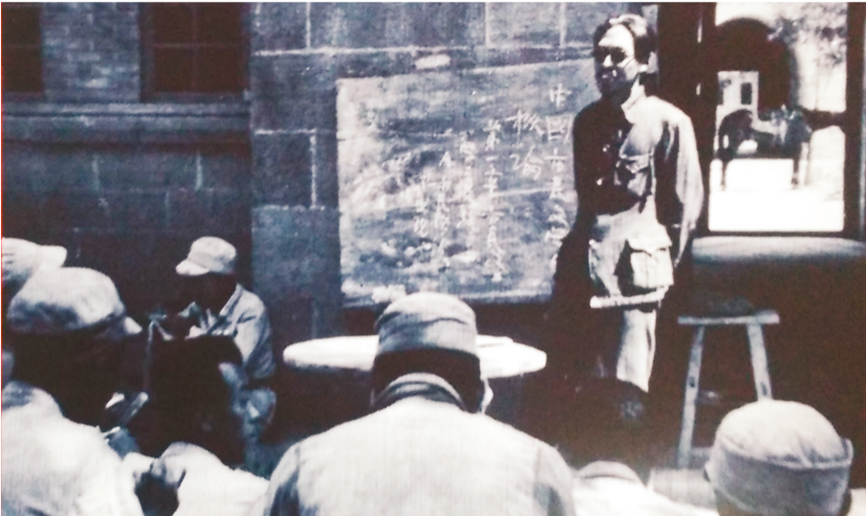
1940年,茅盾在延安鲁艺给文学系学员授课。(本版未署名图片为资料片)

东北作家在延安还有过一次值得纪念的小小聚会。1941年“九一八”这天,19名作家联