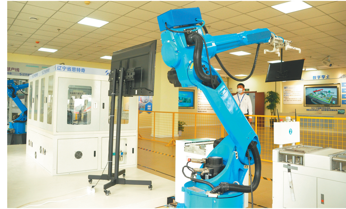
思特奇信息技术有限公司智能制造演示中心。