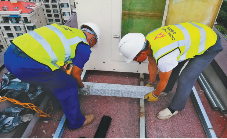
工作人员在5G基础设施建设现场施工。(资料片)

调动全民全民全力招商的积极性。鞍山市将牢固树立“人人都是招商主体”的意识,充分调动一切可以调动的力量,推动人人时时处处为招商作贡献。其中,全员招商就是无论党委、人大、政府、政协等机构部门的人员,还是群团组织和企事业单位人员,都要自觉投身招商第一线,作好表率。全民招商就是域内所有法人和自然人,包括行业协会、科研院所、龙头企业等社会组织,都有责任义务为招商引资献计出力。全力招商就是把眼界放到城外,借助外脑外力,充分发挥驻外机构力量、外地鞍山商会、全球鞍山人,以及所有熟知鞍山、关心鞍山的国际国内友人,帮助宣传城市形象、对接项目,切实把招商引资的“朋友圈”做大。