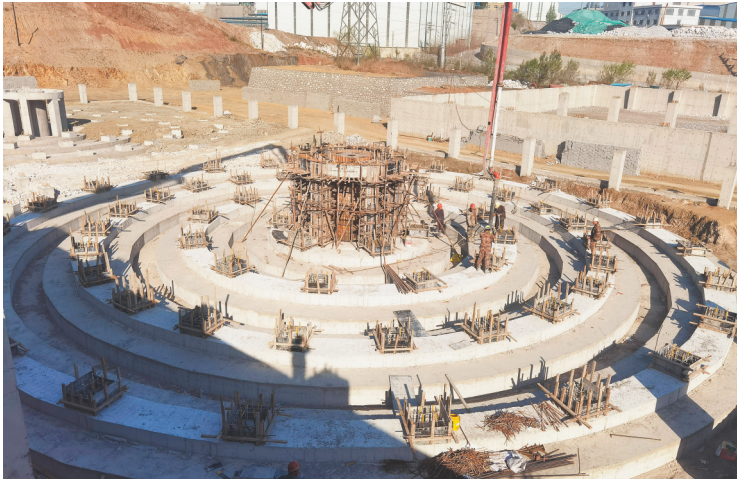
海域菱镁产业项目施工现场。(资料片)

招商引资是项目建设的“源头活水”,项目建设是经济增长的重要支撑。来之不易的招商引资项目,只有从纸上落到地上,从协议变成厂房生产线,尽快达产见效,对高质量发展的引擎作用才会得到充分释放。