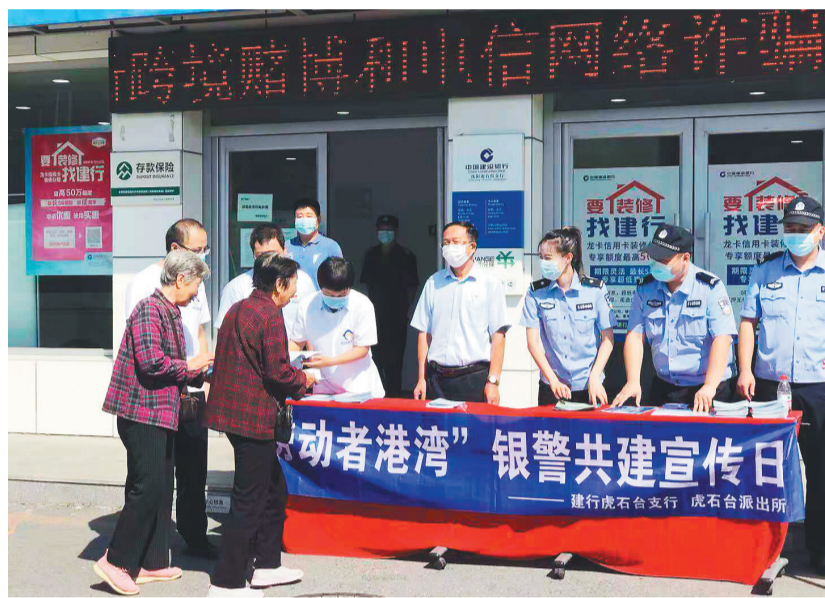
建行沈北新区支行与属地派出所开展“警银共建宣传日”活动。

一直以来,建设银行辽宁省分行勇担金融知识教育宣传之责,面向金融消费者和投资者,全面宣传基础金融知识、红色金融史和金融风险防范技能,帮助其理性选择适合自己的金融产品和服务,增强风险防范意识和责任意识,倡导理性投资和合理借贷,远离非法金融活动;引导金融消费者自觉抵制网上金融谣言和金融负能量,将“金融为民”“消保为民”做实做细。