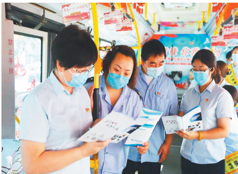
建行沈阳大东支行在258路公交车上开展流动宣传。