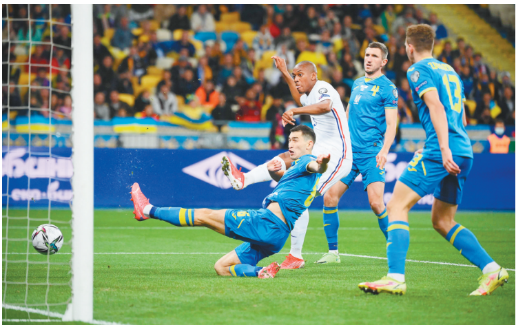
9月5日,法国队球员马夏尔(左二)在比赛中破门。

新华社柏林9月5日电 2022年卡塔尔世界杯欧洲区预选赛5日进行了13场比赛,乌克兰队主场1:1逼平法国队,小组赛连续5场以平局结束,荷兰队、以色列队分别以4:0和5:2战胜黑山队和奥地利队。