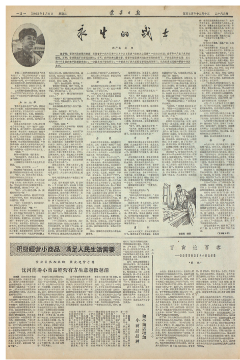
1963年1月《辽宁日报》完整、充分地报道雷锋事迹。

(本文为国家社科基金项目“高校思政课程应用中华优秀传统文化资源的‘四三二一’教学体系建设研究”(19VZ108)阶段性成果)