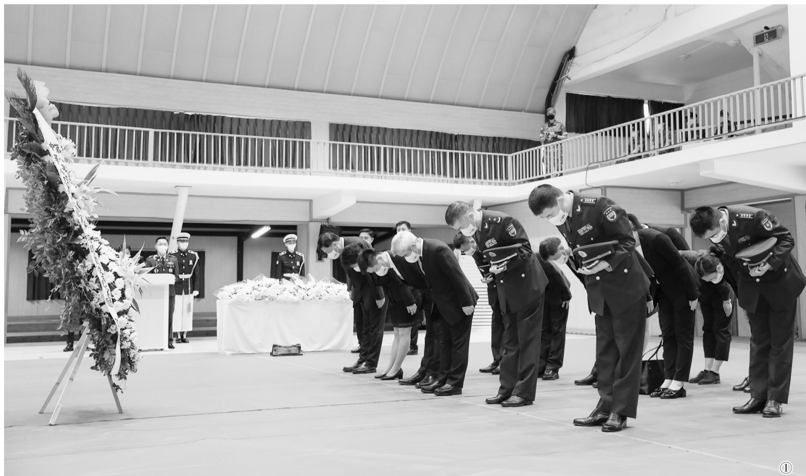
图①:9月1日,在韩国仁川,中方代表团成员在志愿军烈士遗骸装殓仪式现场鞠躬致敬。