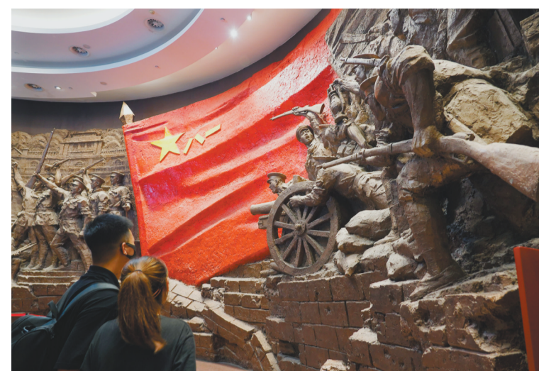
8月1日,游客在南昌八一起义纪念馆游览参观。当日是“八一”建军节,不少游客来到南昌八一起义纪念馆参观游览,缅怀先烈。