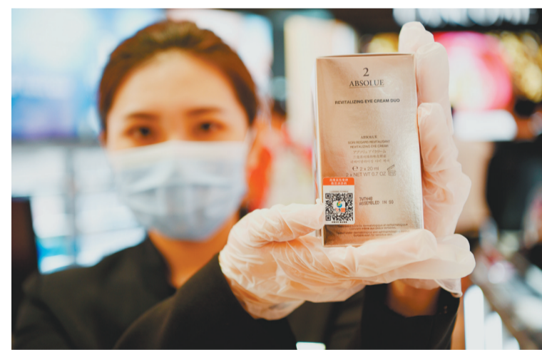
7月31日,海口日月广场免税店的工作人员展示加贴溯源码的香化商品。《海南自由贸易港免税商品溯源管理暂行办法》8月1日开始实施。据介绍,8月1日起,香化、酒水、手机3类离岛免税商品将加贴溯源码销售;12月底,所有离岛免税商品加贴溯源码。如果离岛居民日常消费的“零关税”政策落地,免税日用消费品也要加贴溯源码后销售。