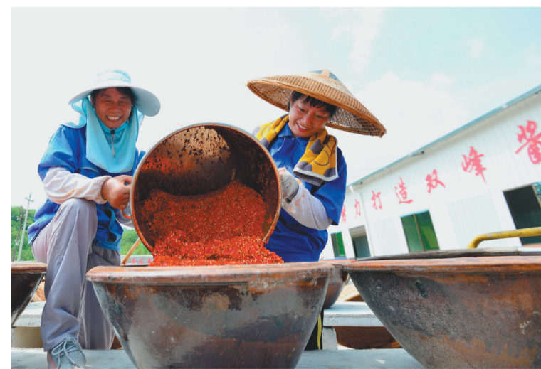
7月31日,在湖南省娄底市双峰县永丰街道的一家辣酱晾晒场,工作人员往酱胚里添加刺碎的鲜辣椒。随着三伏天的到来,湖南省娄底市双峰县各家辣酱生产企业、农户纷纷开始晒辣酱。近年来,双峰县通过“公司+合作社+基地”的模式大力发展传统产业永丰辣酱,成为当地农民增收致富的重要途径。永丰辣酱是双峰县的国家地理标志保护产品,已有数百年的制作历史。