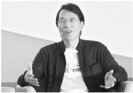
报告文学作家何建明。

核心提示 辽宁省全民读书节已连续举办十届。十年树木，全民阅读的种子在辽宁大地生根、发芽、结果。 随着时代发展,读书节活动不断丰富着新内容、新领域、新形式、新载体,在广度和深度上不断拓展。如果说,去年的辽宁省第九届全民读书节以“云”为关键词,那么今年读书节的关键词就是“融”。从“云”传播到“融”变奏,全民阅读的聚合效应不断放大。