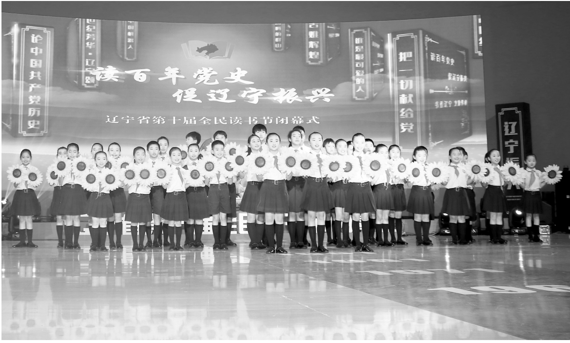
辽宁省第十届全民读书节闭幕式现场。