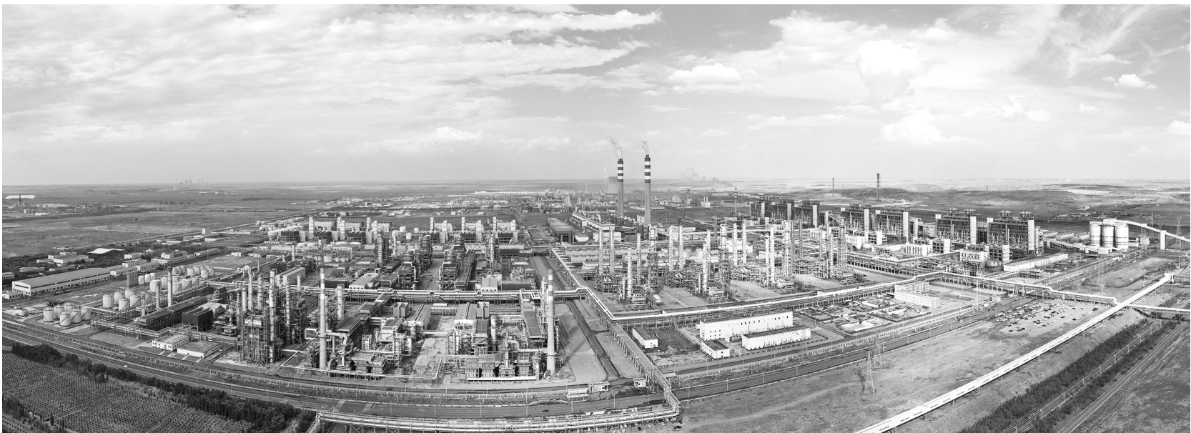
国家能源集团宁夏煤业有限公司400万吨煤制油项目全景(无人机照片,7月16日摄)。