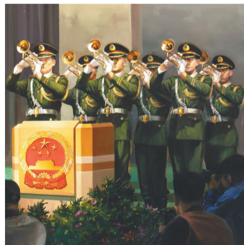
《澳门回归祖国》的局部细节