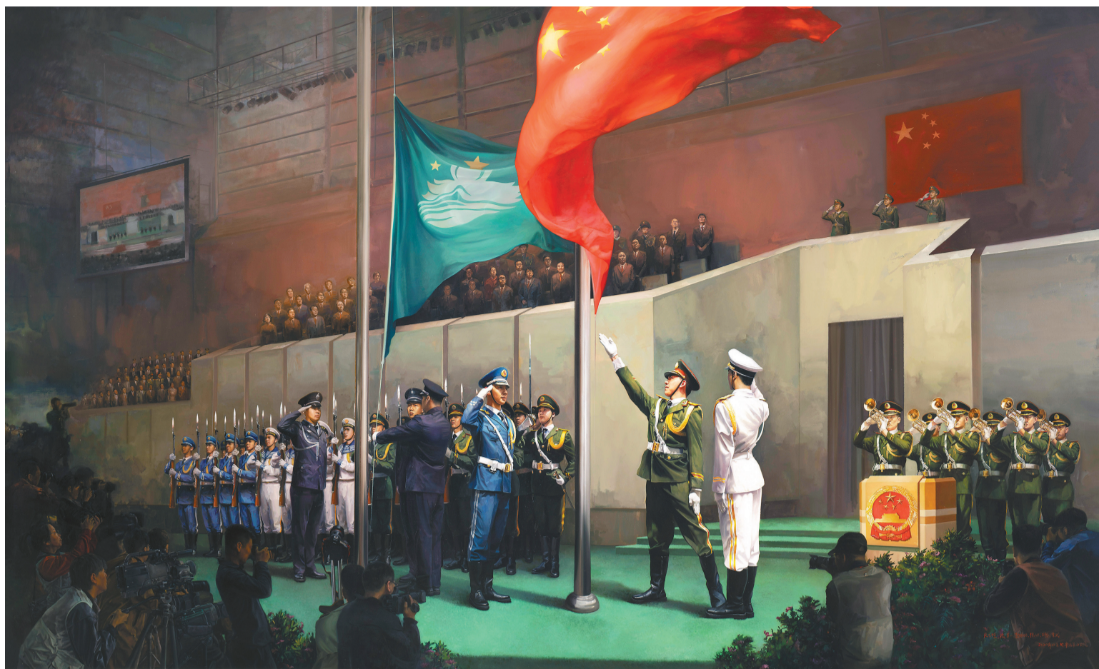
油画《澳门回归祖国》作者:及云辉 陈旭 张贯一 李鹏鹏 王腾 现收藏于中国共产党历史展览馆

辽宁省最终入选20件作品。在中国共产党历史展览馆陈列展出辽宁作品13件,占比约10.7%,位居全国各省前列。