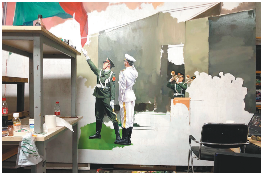
《澳门回归祖国》的创作过程