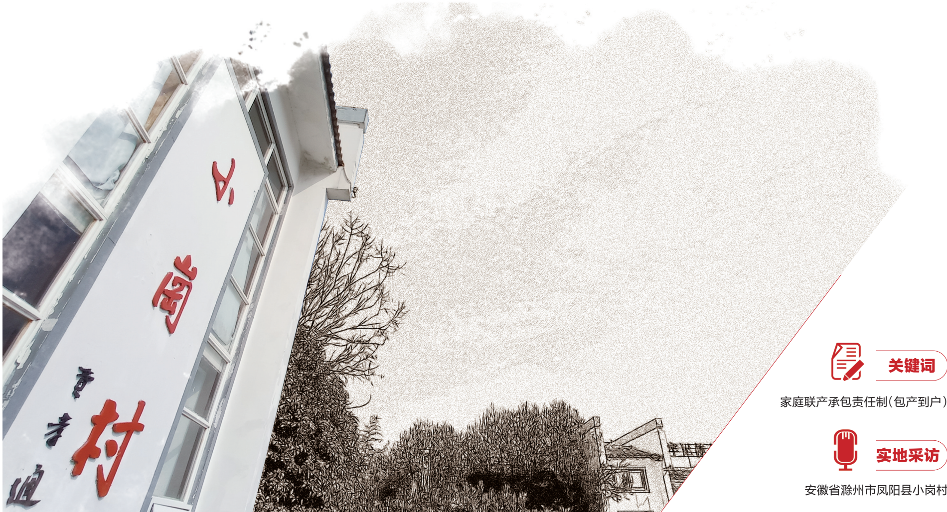
小岗村在中国改革开放史上留下了深刻的印记。