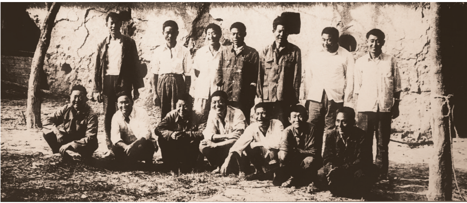
部分“大包干”带头人合影。