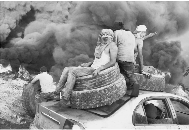
6月23日,在约旦河西岸城市纳布卢斯附近,巴勒斯坦人参加针对以色列扩建犹太人定居点的抗议活动。