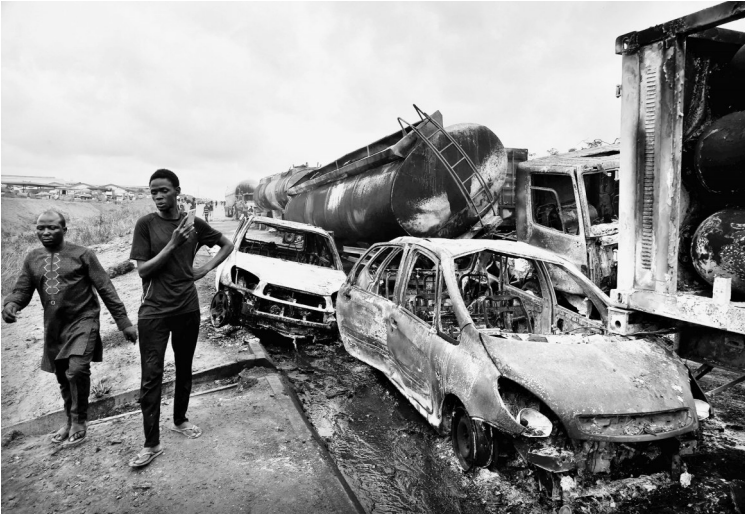
6月22日,在尼日利亚拉各斯-伊巴丹高速公路,人们走过被烧毁的车辆。尼日利亚一条公路22日发生连环车祸事故,造成2人死亡。