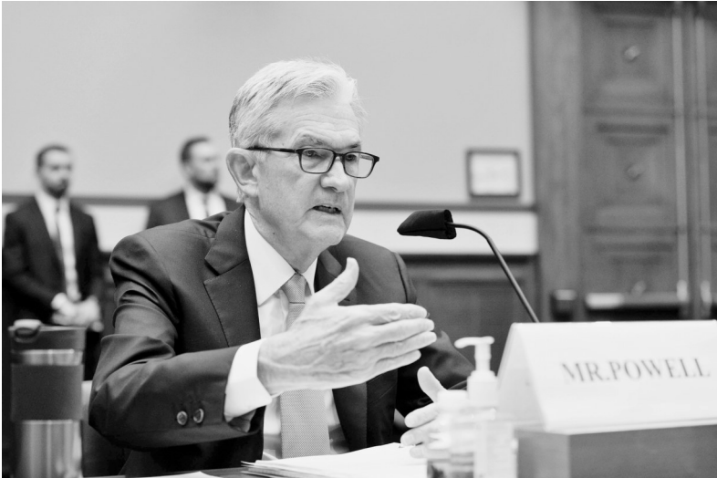
6月22日,美国联邦储备委员会主席鲍威尔在华盛顿出席国会听证会。

新华社华盛顿6月22日电 (记者许续 高攀) 美国联邦储备委员会主席鲍威尔22日表示,当前美国经济面临的通货膨胀压力较早