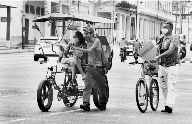
6月22日,人们在古巴首都哈瓦那戴口罩出行。古巴公共卫生部22日公布的数据显示,过去一天该国新增新冠确诊病例1489例,累计确诊病例达170854例。