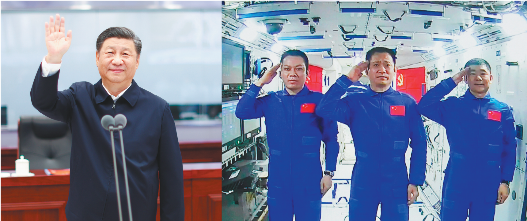
六月二十三日,中共中央总书记、国家主席、中央军委主席习近平来到北京航天飞行控制中心,同正在天和核心舱执行任务的神舟十二号航天员聂海胜、刘伯明、汤洪波亲切通话。

新华社北京6月23日电 中共中央总书记、国家主席、中央军委主席习近平23日上午来到北京航天飞行控制中心,同正在天和核心舱执行任务的神舟十二号航天员聂海胜、刘伯明、汤洪波亲切通话,代表党中央、国务院和中央军委,代表全国各族人民,向他们表示诚挚问候。 中共中央政治局常委、国务院副总理韩正参加活动。 神舟十二号飞船6月17日发射升空以来,习近平十分关心3名航天员的身体和执行任务的情况,23日专程来到北京航天飞行控制中心同航天员通话。 上午9时35分,习近平等走进指挥大厅,通过现场大