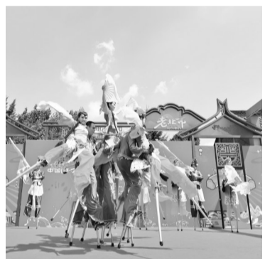
展演中的海城高跷秧歌。

辽剧与辽南的历史、地理、风俗、文化相结合,极具深厚地方传统和浓郁生活气息。此次来自营口市鲅鱼圈区芦屯镇的辽剧表演,加深了观众对辽剧的了解。