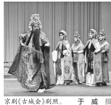
京剧《古城会》剧照。

50年来的舞台艺术生涯热泪盈眶,他表示要退而不休,退休后会继续传艺,努力传承唐派京剧艺术。据了解,盛京戏曲论坛即将举办的研讨活动围绕评剧筱派艺术创始人、评剧表演艺术家筱俊芳的舞台艺术展开,筱俊芳在80多年的演艺生涯中,演出了200多出剧目,学习各家运用低腔之长,并吸收了单弦、大鼓等演唱方法,形成了低回婉转、节奏灵活、俏丽多姿、收放自如的艺术风格。