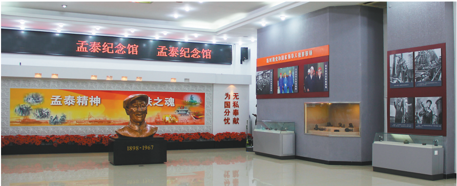
鞍钢孟泰纪念馆分四个展区讲述孟泰为共和国钢铁事业忘我奋斗的一生。