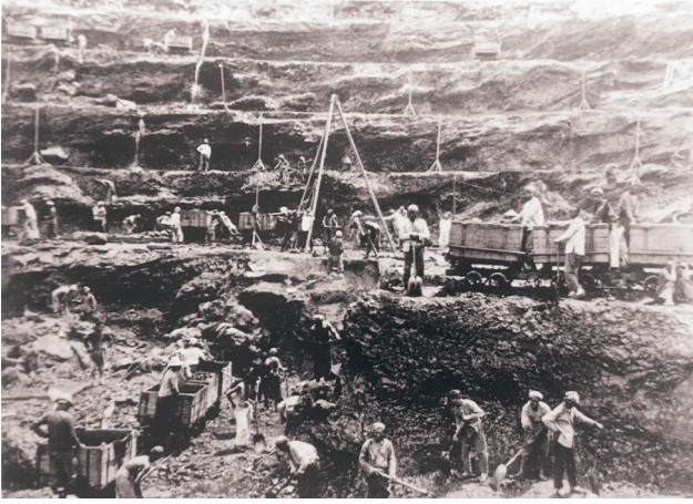
上世纪20年代，抚顺煤矿工人在恶劣条件下工作。