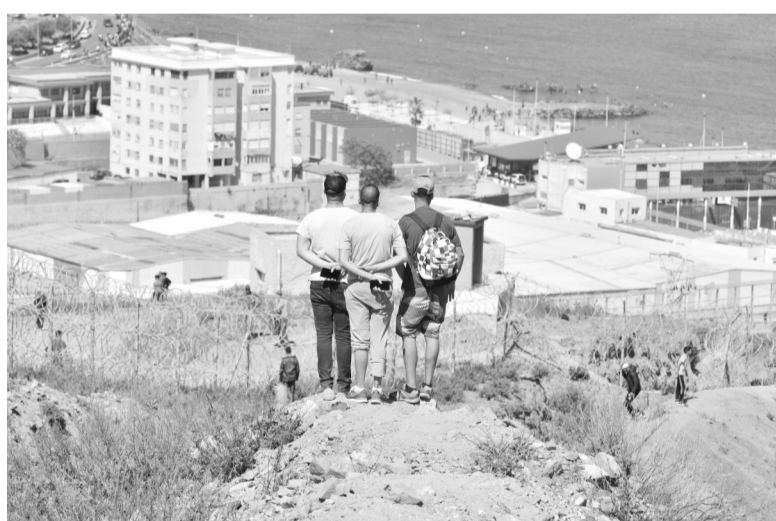
据报道,17日至18日晨,大约6000名非法移民从摩洛哥游泳或划船进入摩洛哥北侧,地中海沿岸的西班牙飞地休达。近年来,大量偷渡者选择从摩洛哥前往欧洲,从摩洛哥前往西班牙成为非法移民赴欧洲的主要路线之一。 上图为5月18日,人们从摩洛哥翻越越界围栏试图进入西班牙飞地休达。 下图为5月18日,人们聚集在摩洛哥与西班牙飞地休达的边界围栏附近。