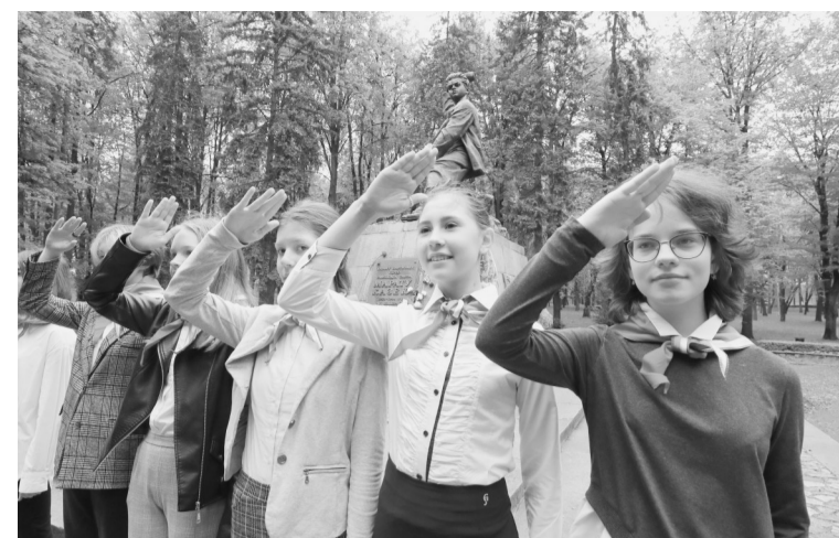
5月19日,在白俄罗斯首都明斯克,少先队员在一处少先队英雄纪念碑前敬礼。当日是白俄罗斯少年先锋队建队纪念日。白俄罗斯少先队建于1922年,目前白全国7到14岁的青少年儿童中有76%的人为少先队员或预备队员。每年5月19日少先队建队纪念日当天,各少先队接纳少先队员预备队员为少先队员。