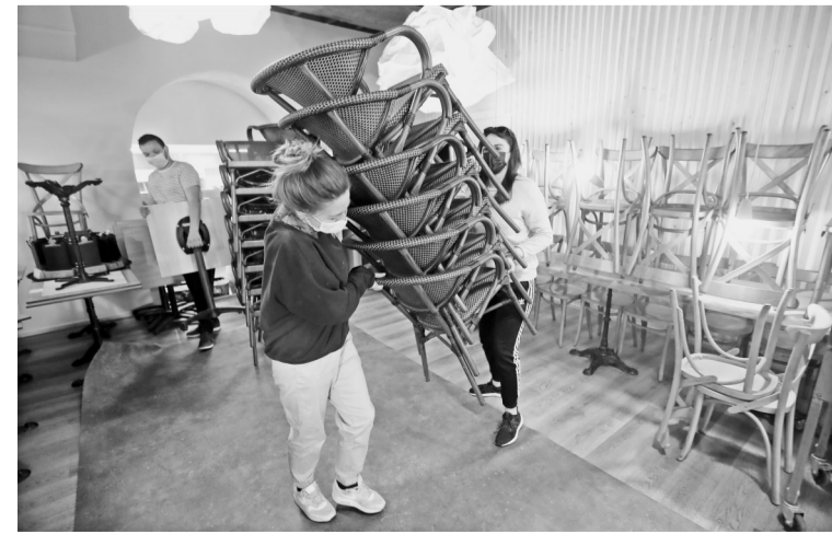
5月18日,工作人员在法国蒙彼利埃的一家餐厅进行重新开放前的准备工作。法国自5月19日起将有条件开放博物馆、电影院、剧院等文化场所,商店也将开门营业,餐馆、酒吧和咖啡馆的室外区域将开放,每桌限6人。