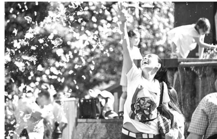
5月18日,一名女子在俄罗斯莫斯科亚历山大花园的喷泉边戏水。莫斯科当日气温达到30℃,打破19世纪末期以来同期最高气温纪录。