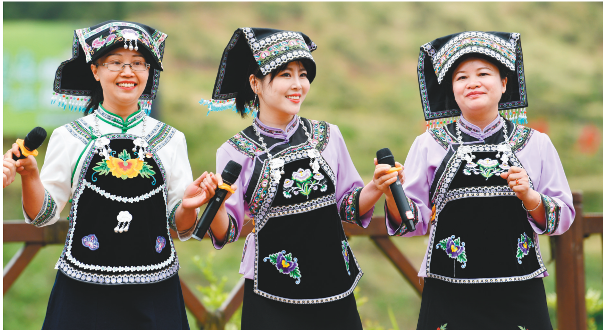
上图为5月19日,在贵州省龙里县谷脚镇茶香村,少数民族同胞参加庆祝活动。