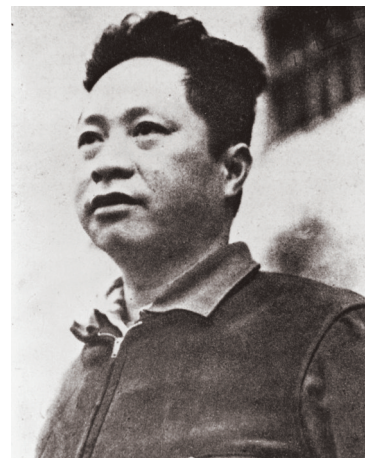
这是叶挺像。

叶挺原名叶为询,1896年出生于广东惠州农家,启蒙老师陈敬如为其改名“叶挺”,意为“人要上行,叶要上挺”,有挺身而出、拯救中华之期冀。