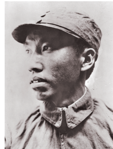
这是左权像。

1905年,左权出生在湖南省醴陵县(今醴陵市)的一个农民家庭,1924年入黄埔军校一期学习,1925年加入中国共产党,后在黄埔军校教导团任排长、连长,参加了讨伐陈炯明的两次东征。1925年12月赴苏联学习,先在莫斯科中山大学学习,后转入伏龙芝军事学院深造,1930年回国后到中央苏区工作。