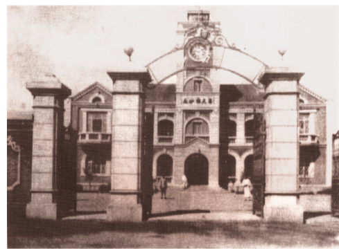
奉天纺纱厂老照片。

当时还有一个大背景是,从1929年7月起,奉天纺纱厂只给工人开半资(其余部分拖欠),而且是奉票。由于奉票贬值极快,工人损失很大,更激发了工人憎恶资本家和反对军阀混战的情绪。刘少奇决定利用这个机会,他指示孟坚等党员在纺纱厂组织工人开展“要现洋不要奉票”的