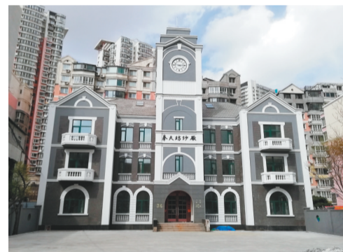
奉天纺纱厂旧址现状。

斗争。正当此时,全国总工会代表张昆弟来到纺纱厂,与党支部书记常宝玉、工人党员崔凤翥、老范等谈话,商定由党支部在工人中宣传,提出要八成现洋并及时开支的要求,如果厂方不答应,就在8月27日开支当天举行罢工。