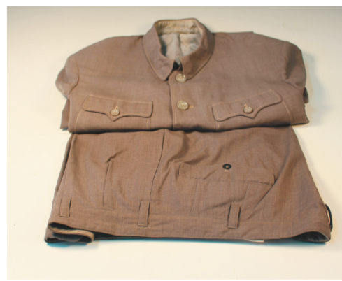
刘少奇穿过的中山装。

资料显示,奉天的工人运动,为中共满洲省委领导工人运动提供了宝贵的经验。奉天纺纱厂党支部被破坏后,于1932年12月再次建立。