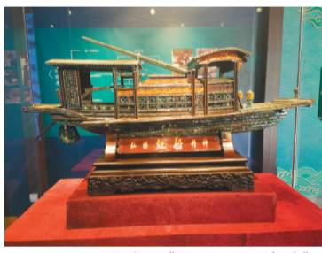
贝雕作品《弘扬红船精神》。

5月7日,由文化和旅游部恭王府博物馆、辽宁省文化和旅游厅主办,中国工艺美术学会传统工艺协同创新中心工作委员会学术支持,大连市文化和旅游局、大连市甘井子区人民政府承办的“贝雕天工 万物更新——辽宁省非物质文化遗产大连贝雕精品展”在北京恭王府博物馆开幕。