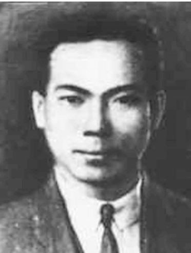
陈延年像

“为了国家奉献自己,不分年龄大小。这是先辈陈延年给我最深的体悟。”近日,青年演员张晚意在社交媒体分享了在影视剧《觉醒年代》中扮演陈延年的感受。令“90后”张晚意震撼的是,陈延年作为那个年代的“90后”,虽身处于黑暗,却心中始终充满光明,“他被国民党反动派杀害时年仅29岁,是一位有激情的热血青年”。 陈延年又名遐延,陈独秀长子,是中国共产党早期著名活动家、卓越领导人和杰出的无产阶级革命家。1898年生于安徽怀宁,1919年12月,21岁的陈延年赴法国勤工俭学,与赵世炎、周恩来一起创建旅欧共产主义组织——中国少年共产党。1922年秋,他加入法国共产党,不久转为