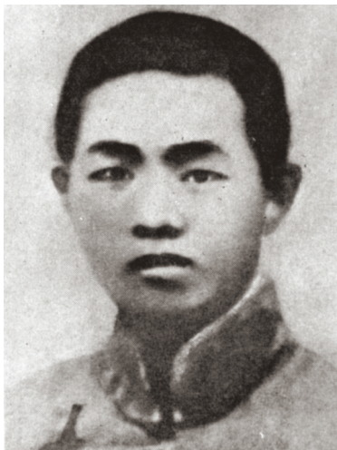
邓恩铭像

1931年4月5日,在山东省济南市纬八路侯家大院刑场,一名出生于贵州的水族青年身负镣铐,与其他20多名共产党员一起,高唱《国际歌》从容就义。