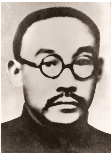
何叔衡像

何叔衡,1876年出生,湖南省宁乡人。1913年何叔衡考入湖南省立第一师范讲习班,与毛泽东、蔡和森等同学志同道合,成为最好的朋友。1918年4月,他与毛泽东、蔡和森等发起组织成立新民学会,曾任执行委员长。