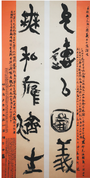
陈巧令 篆书 允德无私联