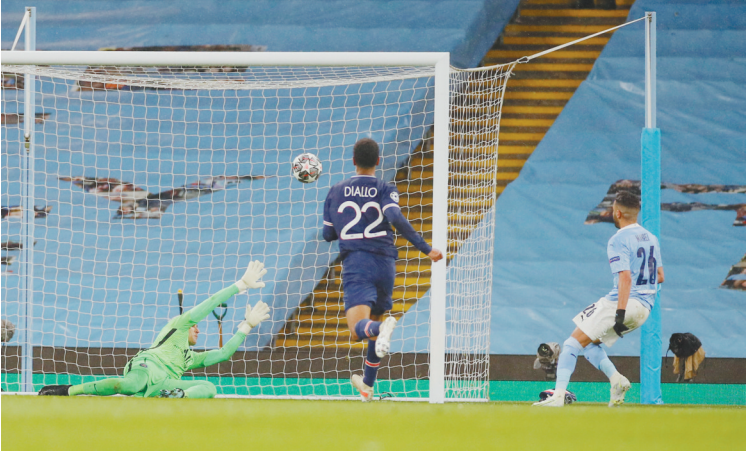
5月5日,曼城队球员马赫雷斯(右)在比赛中打入第二粒进球。

新华社伦敦5月5日电 凭借前锋马赫雷斯独中两元,曼城队5月5日在欧冠半决赛次回合比赛中以2:0击败巴黎圣日耳曼队,从而以两回合4:1的总比分淘汰对手,历史上首次进入欧冠决赛。