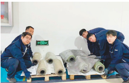
神工已突破多项半导体硅材料产业关键技术。

公司长期专注于单晶硅材料的研发、生产和销售,产品几乎全部用于出口,国际市场占有率13%至15%。研发团队从公司创立开始便和生产团队紧密配合,迅速取得业内领先成果,公司率先在国内实现19英寸晶体量产,成功研发业内首批17英寸硅单晶体。随着5G等产业的逐渐成熟,产业上游对单晶硅材料的需求日益增加。目前,国内的IC制造厂家绝大多数不得不依赖进口,而锦州神工半导体股份有限公司研发的产品便填补了这一国内巨大的科技空白。