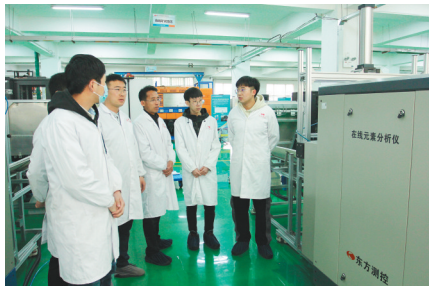
公司为建设数字辽宁不断贡献力量。

公司成立伊始,就以数字化、自动化、信息化、智能化、无人化的专业公司为定位,立志打破发达国家的垄断,瞄准水泥生产线的质量检测控制设备开展科研攻关。在前期准备工作中就要掌握核电子学、结构设计、软件算法、化学、机械电子等相关资料。5年时间,公司经历了一次次失败、叠加、催化,终于将国产第一台水泥在线分析仪展现于国人面前。目前,公司在大型自动化系统、工业应用软件、卫星定位调度指挥系统、机器人等高端产品的研发领域均硕果累累。