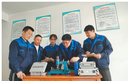
意邦新材料技术处于国内先进水平。

经过数年持续不断的努力,团队申请专利20余项并相继产业化,多项技术填补了国内空白,广泛应用于工业、建筑等行业。