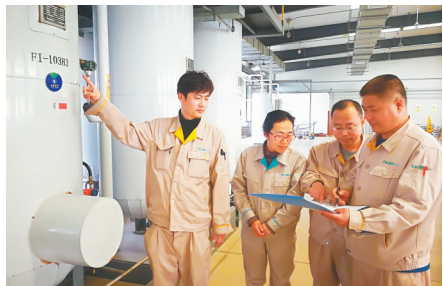
大连科利德产品技术达到国际先进水平。

公司坚持把“提升产业链供应现代化水平,大力助推科技创新,加快关键核心技术攻关,打造未来发展新优势”作为准绳,建立产学研联盟,深入开展“创建学习型组织、争做知识型员工”活动,做好职工教育和技能培训,为职工发展搭建平台,为职工圆梦出彩提供机会,把职工的智慧和力量凝聚到全省经济社会发展上来。公司荣获国家“专精特新”小巨人企业、国家集成电路“一条龙”示范企业、国家重点新产品奖、中国中小企业成长标杆企业、辽宁省首批“瞪羚”企业、辽宁省科技进步奖等多项荣誉。