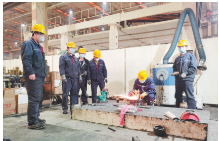
公司产品在国内煤矿企业中得到广泛应用。

天安科技在掘进装备制造技术方面处于业界领先水平。去年,公司生产的大断面矩形煤巷盾构式快速掘进机器人系统正式下线,标志着国内掘进装备领域实现了一次重大技术升级,有效辐射和推动相关产业的“智能化”“无人化”发展。公司被列入“国家火炬计划项目”。公司拥有60余项自主知识产权专利,其中发明专利18项,通过国家及省部级技术鉴定5项,是辽宁省首批国家级高新技术企业、省级企业技术中心、工程实验室、院士专家工作站、辽宁省创新型中小企业。