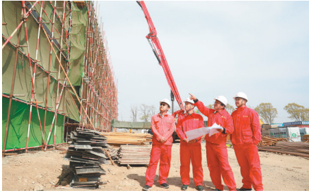
辽河油建多次在重大工程建设中获得奖项。

辽河油建努力打造一支“特别能吃苦、特别能战斗、特别能攻坚、特别能奉献”的铁军队伍,为国家能源建设添砖加瓦。辽河油建在中俄东线天然气管道工程建设中,北段率先完工,中段施工质量进度领跑全线,多次创造重点工程建设辽河速度,刷新全自动焊全国纪录。承建的天然气互联互通“四站一线”工程,实现“当年立项,当年投产”,其中仅用6个月零20天时间便建成了亚洲最大枢纽站中卫压气站。辽河油建足迹遍布全国29个省区,承建的工程获得中国建设工程“鲁班奖”等省部级以上荣誉百余项。