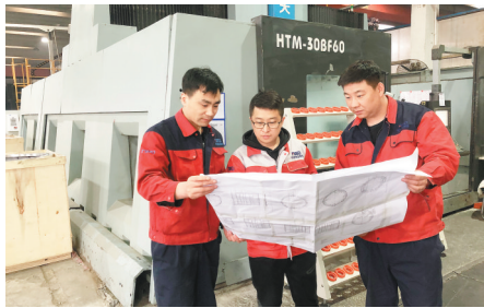
阜新万达铸业产品在全球有较高市场占有率。

集团高度重视科技创新工作,采取多项措施激励职工开展创新创业。集团设立劳模示范岗、党员专家工作站、党员模范先锋岗等引领职工开展技术创新,并出台了相应奖励政策。集团在高压电气领域已成为全球高压电气铸铝壳体行业领军企业,在轨道交通领域已成为中国标准动车组铸铝产品的主力研发、试制和生产基地。在大力开展科技创新的同时,集团生产经营还遵循“绿色铸造,清洁生产”的理念,通过引进国内先进的环保设施设备,采用6S现场管理等方式,致力于打造花园式工厂。