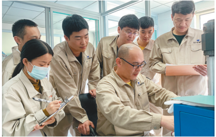
研发车间用科技手段量产金刚石。

2015年,辽宁新瑞碳材料科技有限公司落户营口。仅仅两年时间,生产研发车间完成了6项发明专利、8项实用新型专利及8项软件著作权,并在此基础上大胆创新,成功开发了“人造金刚石大单晶”项目。大尺寸金刚石可以应用在半导体等行业,解决了金刚石材料对进口的依赖,成为领先于国内5年至10年的产品。车间不断强化自身建设,坚持技术练兵,短时间内为企业培养了一批技术骨干,短短数年,便从最初的3人团队发展到今天的36名技术骨干。