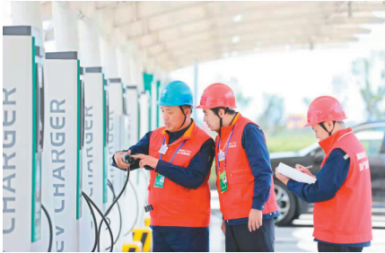
大连供电用一流能源互联网服务振兴发展。

2020年以来,公司将战疫情、保供电作为重要政治任务,累计投入保电人员1.1万人次,有力地保障高、中风险地区以及全市252家防疫重要客户可靠供电。大连供电公司积极践行推动生态文明建设的政治使命,将绿色环保理念融入电网建设与运营各环节。投资6000万元,建成庄河Ⅲ号海上风电场电力输送通道,完成乐甲风电场送出工程,满足12万千瓦清洁能源送出需求。在大连,以风电、太阳能光伏发电、核电为代表的清洁能源比重逐年上升,成为全网的主力电源。