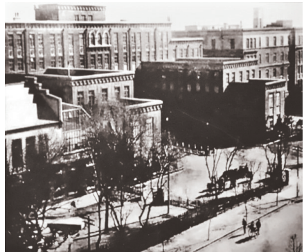
1928年,奉天南满医大旧址 (中共满洲医科大学党支部)