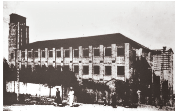
1930年,奉天英美烟草公司旧址 (中共奉天英美烟草公司党支部)