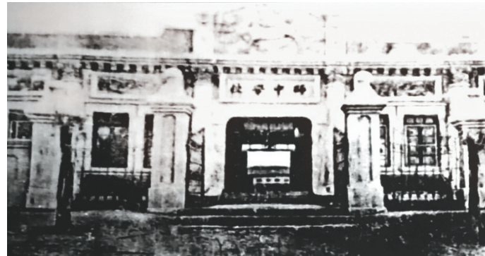
1929年,辽中师范学校旧址 (中共辽中特支)