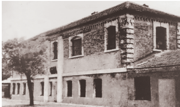
1924年,中共沟帮子铁路党支部旧址

核心的党中央立足中国特色社会主义进入新时代这一新的历史方位,树立“党的一切工作到支部”的鲜明导向。2018年10月,《中国共产党支部工作条例(试行)》(以下简称《条例》)公布,对党支部工作作出全面规范,是新时代党支部建设的基本遵循。指出“党支部是党的基础组织,是党在社会基层组织中的战斗堡垒,是党的全部工作和战斗力的基础,担负直接教育党员、管理党员、监督党员和组织群众、宣传群众、凝聚群众、服务群众的职责”。《条例》以习近平新时代中国特色社会主义思想为指导,贯彻党要求,既弘扬“支部建在连上”的光荣传统,又体现基层创造的新做法新经验,对党支部工作作出全面规范,是新时代党支部建设的基本遵循。