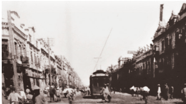
1929年,老瓜堡街道 (中共老瓜堡菜农党支部)