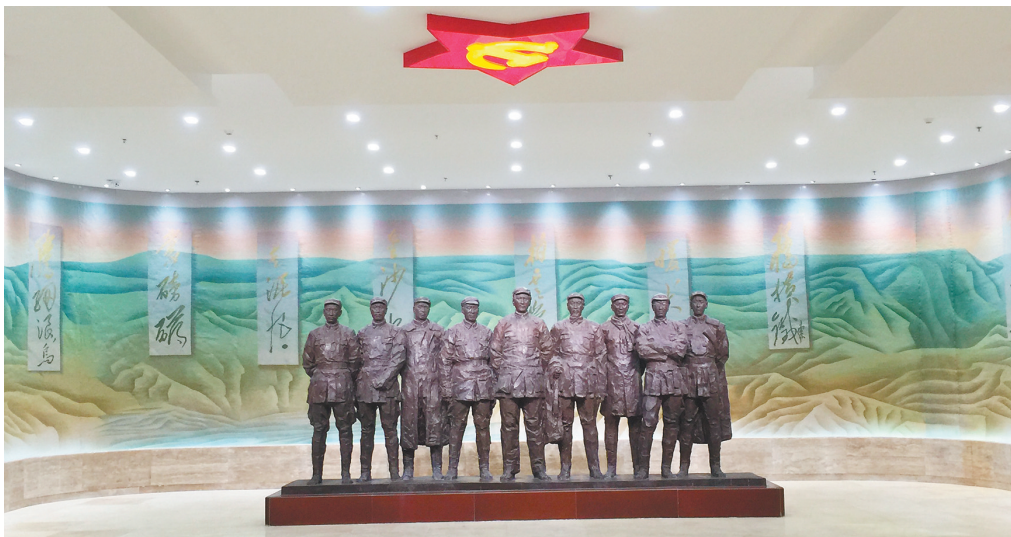
《长征诗情》纤维艺术 林乐成