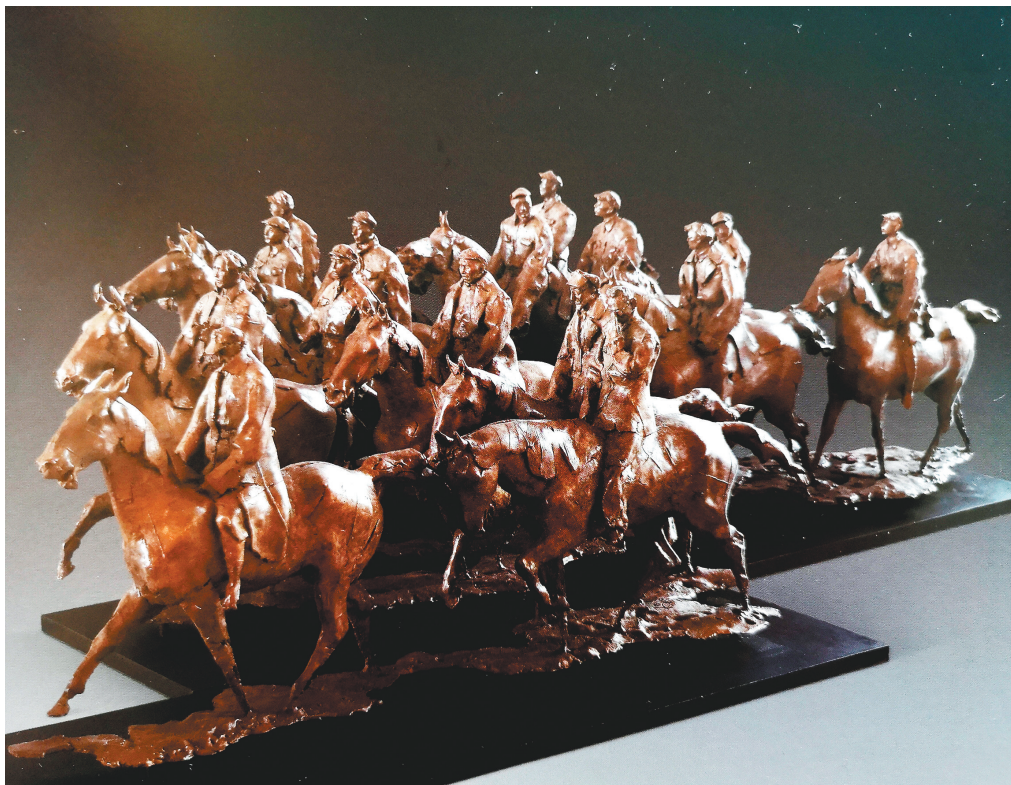
《速写长征——向北? 向北!》雕塑 洪涛 (第12届全国美展银奖)

作品构思于2008年,完成于2014年,共耗时6年,这是洪涛创作生涯中的一次“长征”。洪涛表示:“新时代各种各样的长征仍在进行