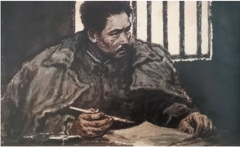
“我何时被枪毙?明天或后天,上午或下午,全不知道,也不必去管。在没枪毙以前,我决意写成这篇文字,献给可爱的中国,算是我临死前的一滴努力!”