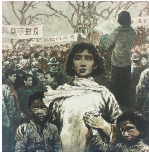
“朋友们,兄弟们,赶快起来,救救母亲呀!亡了母亲的孩子,不是更受人欺负和侮辱吗?”