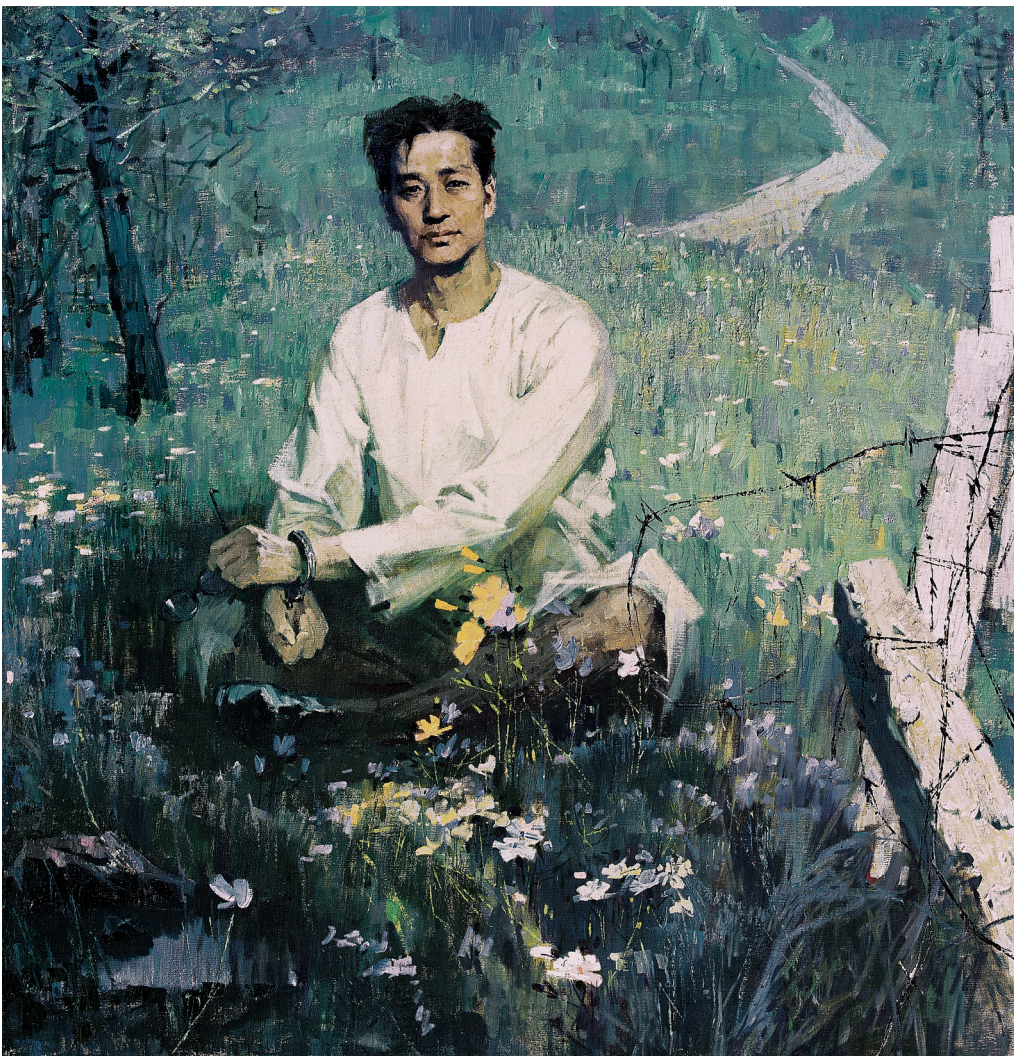
《此地甚好·瞿秋白就义》宋惠民 布面油画 1983年 中国美术馆藏

1919年,瞿秋白参加了五四运动,加入李大钊、张嵩年发起的马克思主义研究会,继而成长为无产阶级革命的忠诚战士。史料记载,1935年6月18日上午,福建长汀中山公园,瞿秋白身穿妻子杨之华亲手缝制的中式对襟衫,泰然浅笑踪影亭下。这是他留在世间的最后一张照片。