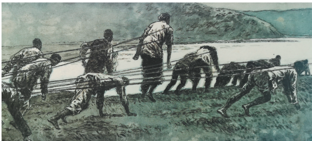
“难道他们不知道用自己伟大的团结力量,去与残害母亲、剥削母亲的敌人斗争吗?”