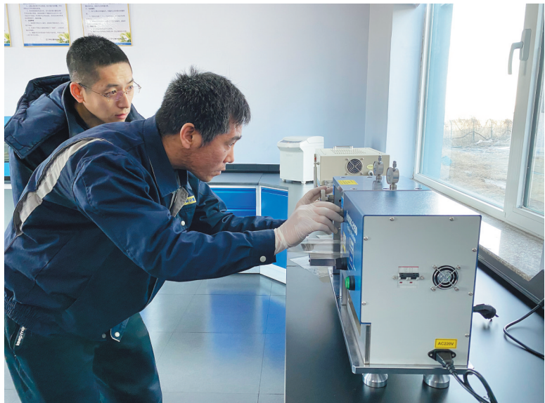
辽宁科安隆科技有限公司启动石墨烯导热膜项目。

除了评估难外,一些企业尤其是中小微企业一旦发生不良贷款,知识产权处置变现缺乏成熟的市场,银行对其知识产权难以处置,企业将面临变现难的情况。