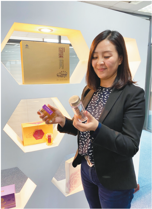
大连普瑞康生物技术有限公司生产的专利产品。

今年召开的全省知识产权工作会议提出,支持沈阳开展知识产权证券化工作,建立完善知识产权证券化配套扶持政策。未来,凭借知识产权,我省科创企业将获得更多融资渠道。