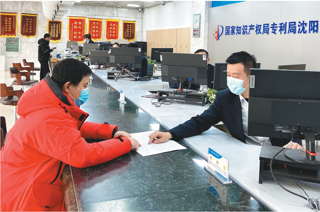
国家知识产权局专利局沈阳代办处开辟绿色通道为企业办理专利质押登记。