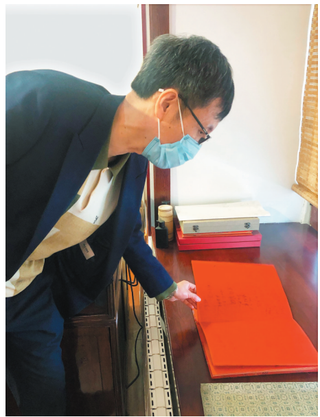
陈云旧居的工作人员展示留言簿。

2019年举办的“陈云在东北”主题展览,通过5个板块、42个版面,38张历史图片资料,全面展示了陈云同志在参加和领导东北解放战争,完成接管沈阳工作并创造了接管大城市的经验,关心和支持辽宁老工业基地建设和发展等方面的历史贡献。