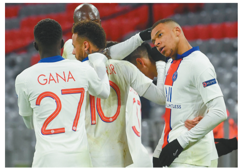
北京时间4月8日，巴黎圣日耳曼队球员姆巴佩(右一)进球后和队友庆祝。

本报讯 记者李翔报道 北京时间4月8日，欧冠1/4决赛进行了最引人关注的一组对决，凭借姆巴佩的梅开二度，巴黎圣日耳曼队客场以3:2力克拜仁慕尼黑队。 巴黎圣日耳曼队有一个梦幻的开局，而这很大程度上要归功于姆巴佩，开场仅149秒，内马尔中路送出精准斜传，姆巴佩禁区右侧接球，冷静右脚射门，皮球从诺伊尔两腿之间飞入球门。下半场，虽然姆巴佩错过了门前补射的机会，但当比赛变成2:2时，又是姆巴佩站了出来，接到迪马利亚中路斜传