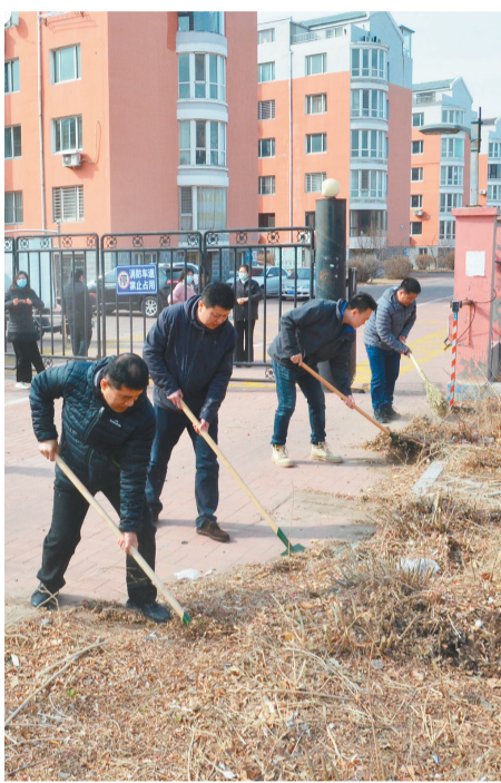
市民政事务中心党员参加义务劳动。