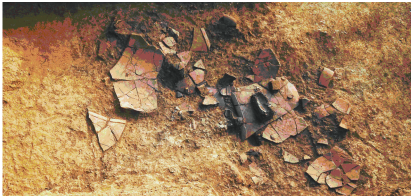
编号为T3平台建筑垫土中陶片出土情况。

中国社会科学院考古研究所外国考古研究室副主任、牛河梁遗址第一地点2号建筑址发掘项目负责人贾笑冰研究员说:“从全国范围来看,在目前发现的同时期建筑遗址中,2号建筑址规模也是最大的。”