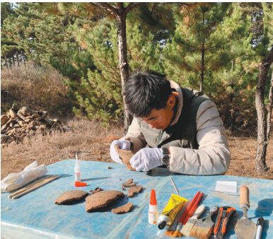
考古人员在仔细研究牛河梁遗址第一地点出土文物。

与建设工程有明确的预期不同,考古发掘属于科学探索,结果带有极大的不确定性,因此很少有考古发掘活动会举行启动仪式。