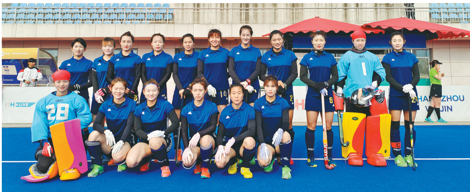
辽宁女子曲棍球队赛前合影。

3月31日下午,辽宁女子曲棍球队经过点球大战,以4:2力克吉林队,在第十四届全运会女子曲棍球资格赛中夺取4连胜,提前获得今年陕西全运会决赛圈入场券。这支辽宁竞技体育的“铁军”将全力向十四运金牌发起冲击,在全运会赛场再创辉煌。