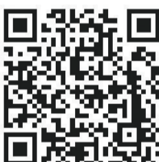
更多精彩 扫码观看