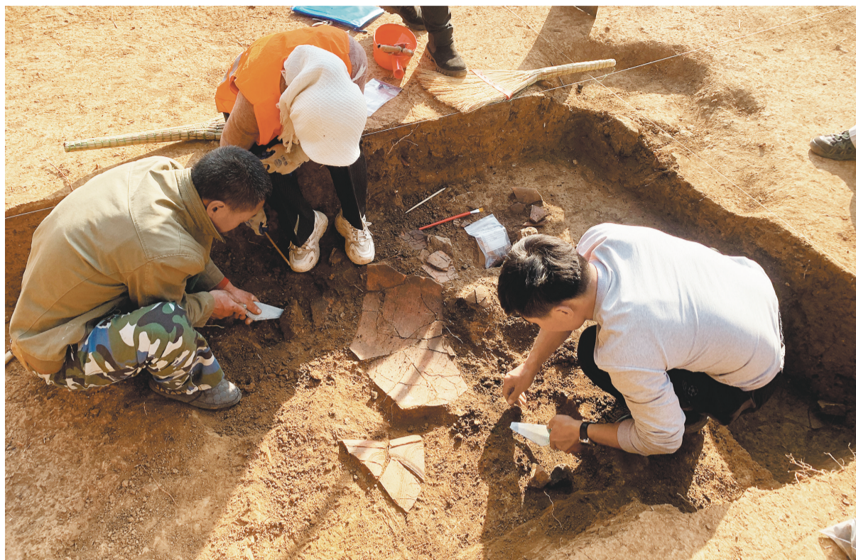
考古人员在发掘文物。

2号建筑址的发掘对进一步讨论牛河梁遗址群形成、发展演变的过程以及其在中华文明起源中的地位和作用有重要意义。