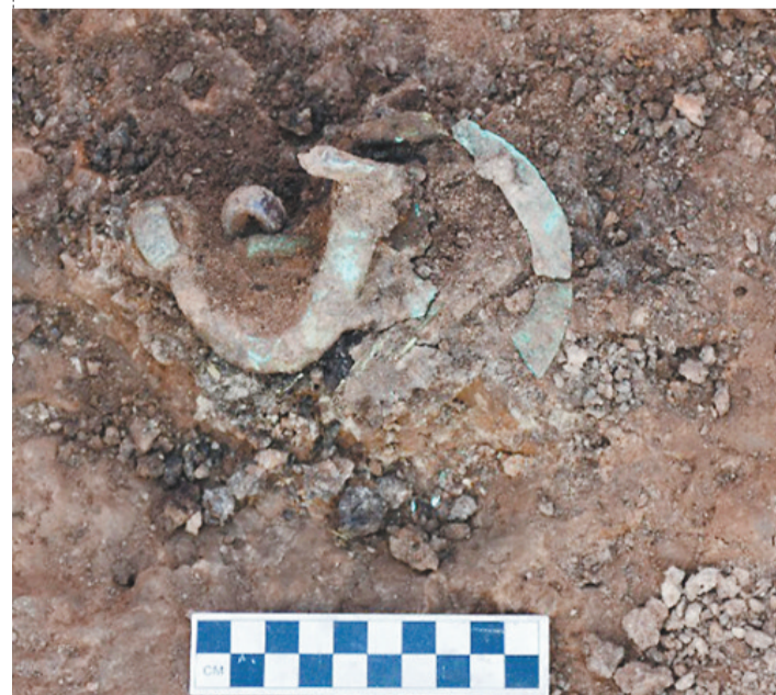
北崴遗址釜钵出土情形。

遗址位于朝阳市建平县朱碌科镇刘杖子村水泉村民组东北侧的台地上。发现房址7座,灰坑49座,墓葬5座,沟2条、圆形黄土台1处。出土文物主要有陶、石、骨、角、牙、蚌、贝、玉等。