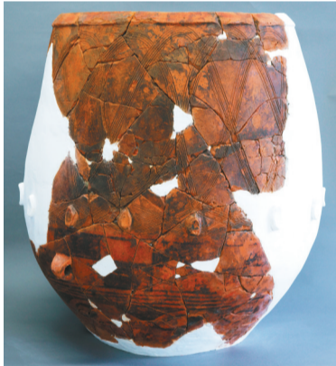
牛河梁遗址第一地点2号建筑址T3平台建筑垫土中出土的圆陶片(左)和陶缸复原图(右)。