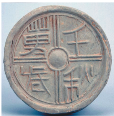
上马遗址出土汉代瓦当。