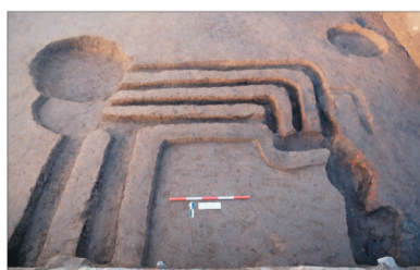
桃李营子遗址F7坑内结构及灶址。

东西两区的遗址位于阜新蒙古族自治县哈达户稍镇哈达户稍村两家子屯中部。发现有环壕、房址、灰坑及灰沟等。文物多为陶器,有少量的石器。