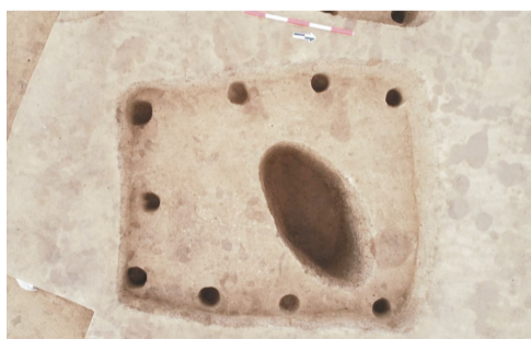
马鞍桥山遗址F9房址。

遗址位于朝阳市建平县太平庄镇石台沟村六家村村民组南约800米的一道小山梁上,南距牛河梁红山文化遗址约60公里。发现房址3座、灰坑22座和壕沟(聚落环壕)1条,出土的文物有陶器、石器、骨角器和贝器等四类。