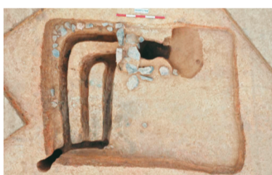
两家子遗址发掘F4房址概貌。