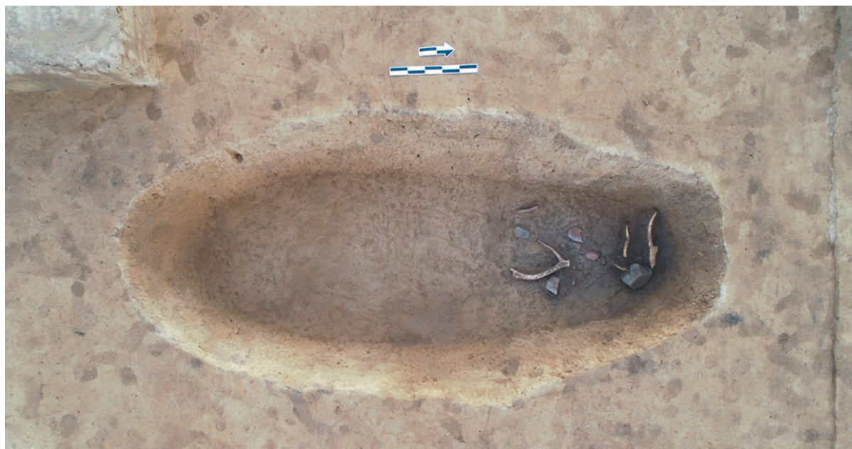
马鞍桥山遗址H25灰坑。