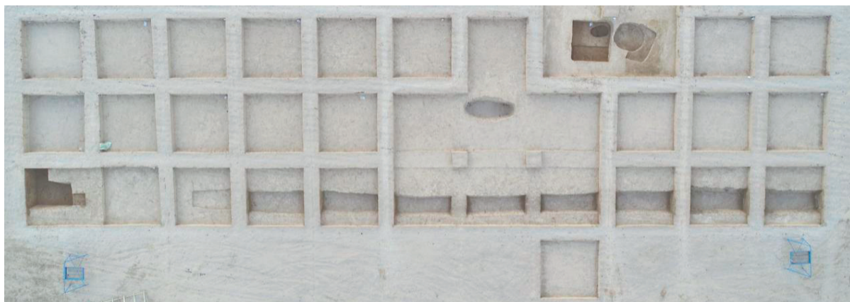
马鞍桥山遗址中G2环壕全景照。