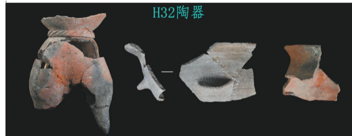
水泉遗址H32灰坑中出土的陶器。

遗址位于阜新蒙古族自治县阜新镇桃李营子村西南1500米处。发掘房址26座,灰坑88座。出土文物有陶、瓷、铜、铁、骨、石六类。